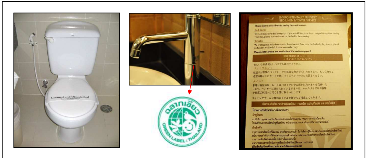
ภาพที่ 2-2 อุปกรณ์และสัญญาณประหยัดน้ำ และป้ายประหยัดพลังงาน