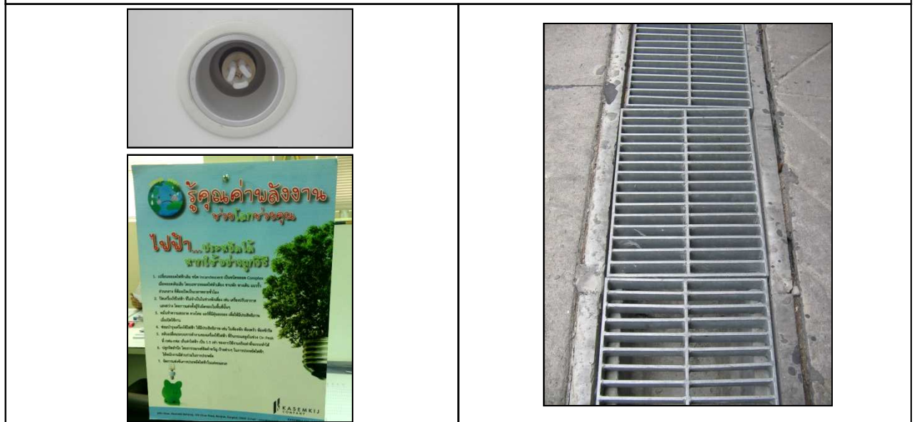
ภาพที่ 2-3 หลอดไฟประหยัดพลังงาน